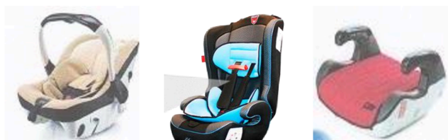
Автолюлька Автокресло Бустер